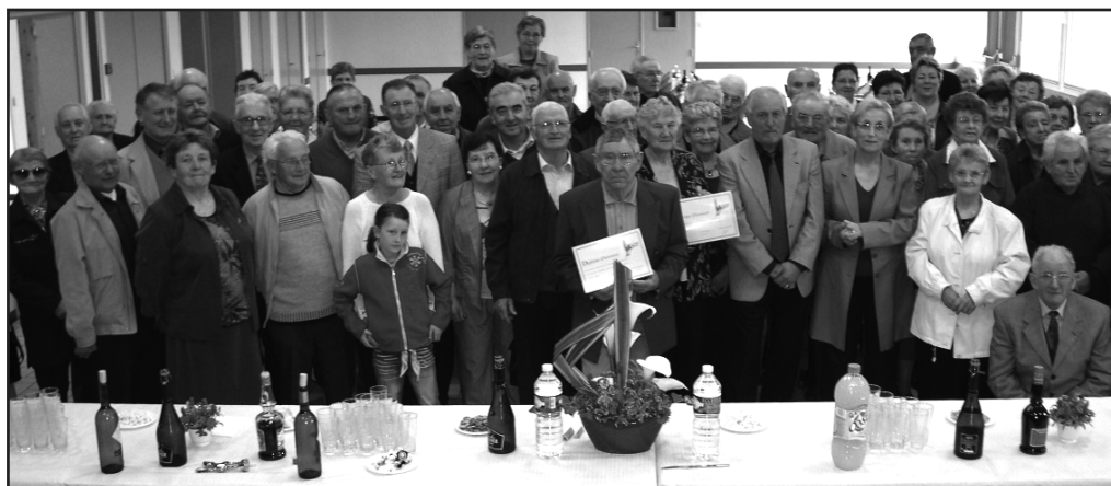
30 ème anniversaire du club Saint-Nicolas