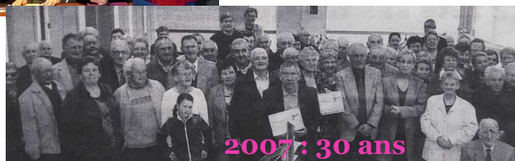
2007 : 30 ans

Ce club est une belle occasion de se retrouver et de partager des moments de convivialité et de représenter le dynamisme des aînés de Saint-Thonan.