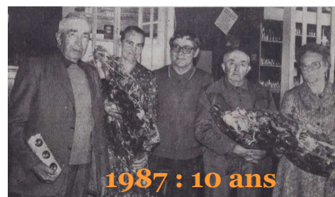
1987 : 10 ans