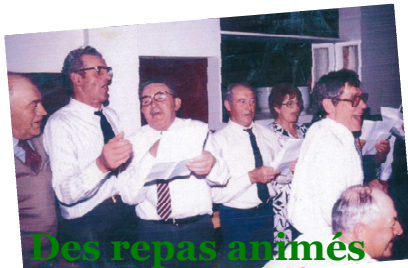
Des repas animés