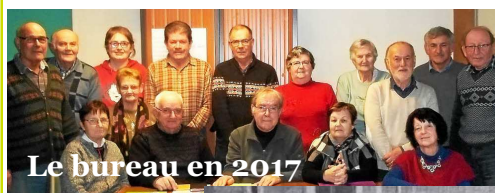
Le bureau en 2017

C'est en mars 1977, que le club des aînés ruraux, baptisé Club Saint-Nicolas, voit le jour. Depuis 40 ans, diverses activités sont proposées comme la pétanque, les dominos, la belote, le scrabble et des sorties. Conscient de l'ère du numérique et de son évolution rapide, depuis 2010, des cours d'informatique sont proposés, au « cyber espace » rue de l'église.