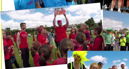
Fête du village