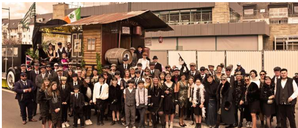
L'ensemble des participants devant le char « GANG S'THO » au Carnaval de Landerneau.

● « Gang S'THO », le char imaginé et construit par une vingtaine de bénévoles du comité d'animation Saintthoanim' a participé au « Carnaval de la Lune étoilée » de Landerneau qui a eu lieu dimanche 21 avril.