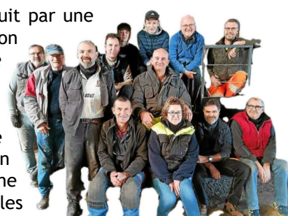
Une partie de l'équipe des bénévoles.

Pour sa 7 ème participation, le char composé d'une distillerie cachant un bar clandestin tracté par une parfaite reproduction d'une Cadillac noire d'époque, plongeait les spectateurs dans une ambiance « année folles et prohibition ».