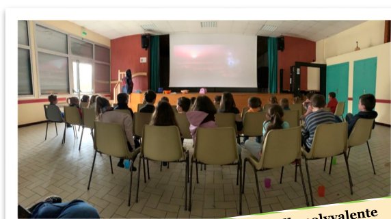
Matinée cinéma à la salle polyvalente