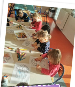
Pop corn en coton et peinture avec du coloriage