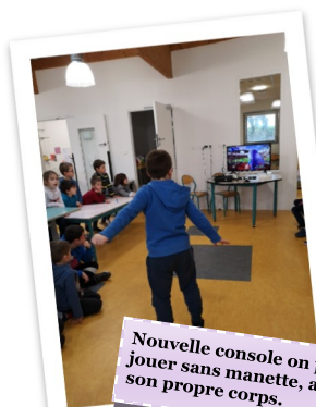
Nouvelle console on peut jouer sans manette, avec son propre corps.