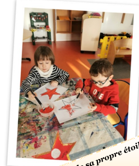
Création de sa propre étoile « Walk of fame »

Lors des récentes vacances scolaires, le centre de loisirs a proposé aux 50 enfants présents :