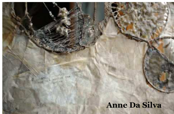
Anne Da Silva

du 15 juillet 2012 au 15 août 2012, de 14 h à 18 h, tous les jours sauf le mardi.